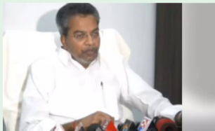
విజయవాడ జనవరి 14 (భారత్ శక్తి):